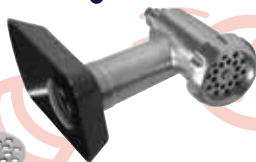
Nastavak za mijevenje mesa

Budite hrabri i pokažite svu raskoš svog kulinarskog talenta uz Electrolux kuhinjske pomoćnike. Pripremite kolač s jajima koji će oduševiti cijelu obitelj!