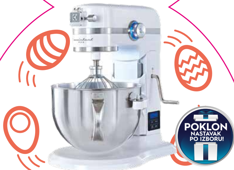
KUHINJSKI ROBOT EKM6100