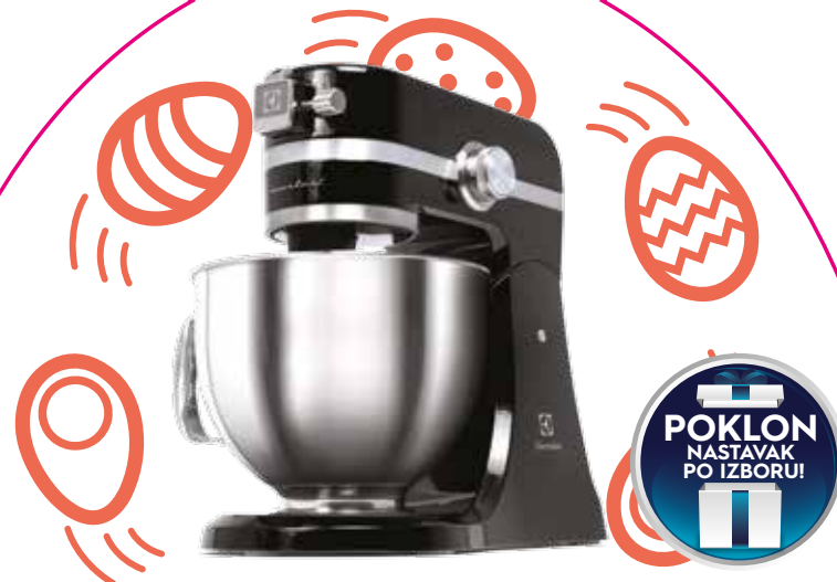
KUHINJSKI ROBOT EKM4200